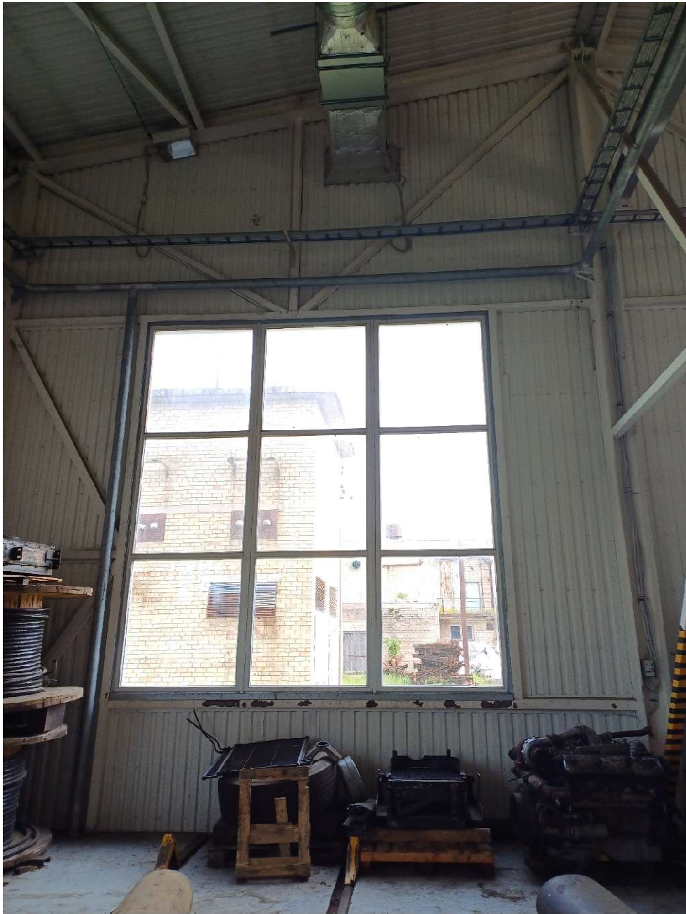
Priedas Nr. 1